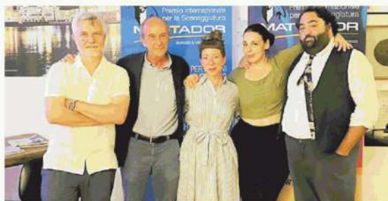
La giuria del Premio Mattador