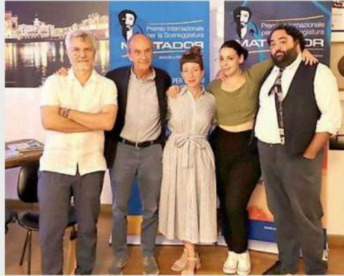
La giuria del Premio internazionale Mattador